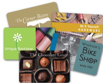
Muestras de tarjetas personalizadas